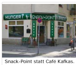
Snack-Point statt Café Kafkas.

Am nächsten Morgen fange ich an, wo auch der Wahlwiener Kafka angefangen hätte: im Kaffeehaus. Laut Internet gibt es in Berlin zwei Lokalitäten, die auf den Namen des Autors hören. In der Neuköllner Pflügerstraße, wo ich das Café Kafkas suche, gibt man sich allerdings unwissend. "Hier war schon immer ein türkisches Männercafé", behauptet die Betreiberin vom Snack-Point, an dessen Stelle laut