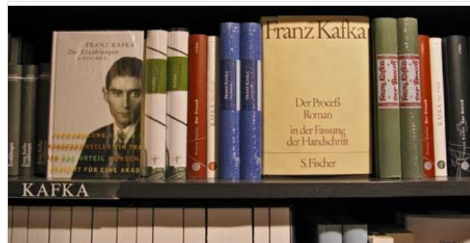
Zeitlos schick im Buchladen: das Kafka-Regal.

Ausdruckslose Gesichter in der Redaktion, als die Sprache auf das Kafka-Gastspiel beim tt09 kommt. Andreas Kriegenburgs Münchner "Der Prozess"-Inszenierung ist eingeladen, doch was soll man dazu sagen – Kriegenburg interessiert, aber Kafka? Warum und vor allem wie soll man überhaupt noch über Kafka nachdenken? Eine Recherche im Selbstversuch.